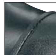
GÜK mit versenkten Nähten