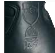
Schnitenschutz Level 1