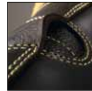
HAIX® FP System