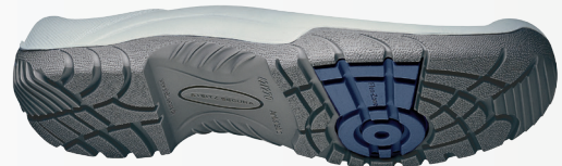
(in den Größen 36-37 mit der Laufsohle Perbunan SST)